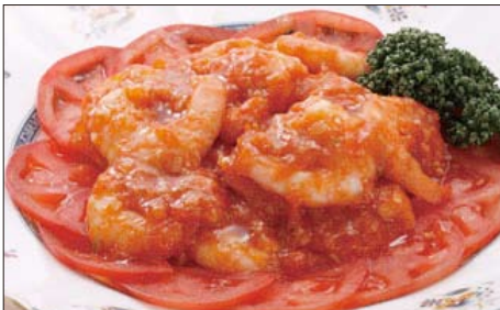
海老のチリソース煮 2,100円