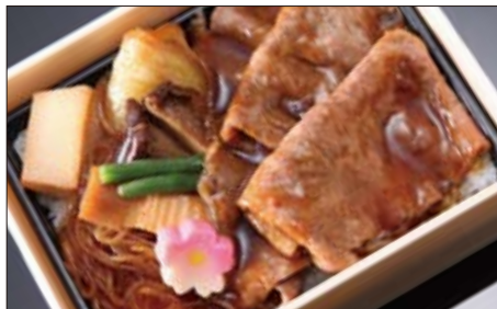
黒毛和牛 "宮崎牛" のすきやき弁当 1,500円