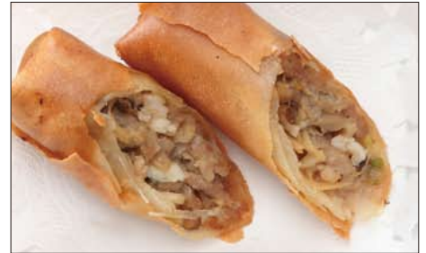
自家製 春巻(1本) 210円