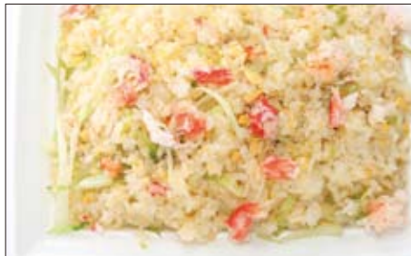
たらば蟹とレタスのチャーハン 1,050円