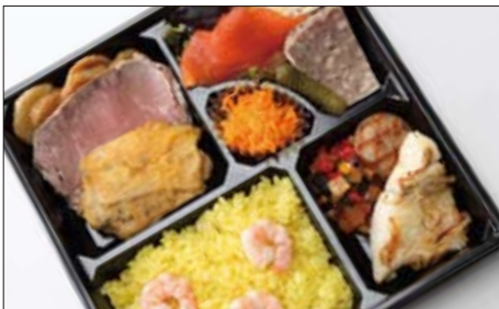
洋食弁当「フレンチバリエーション」 2,100円