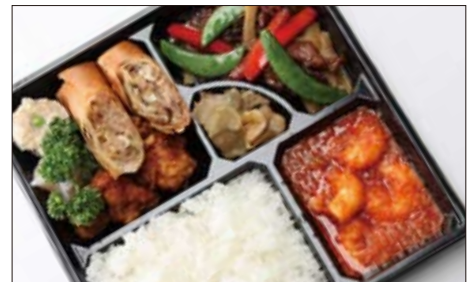
中華弁当「チャイニーズバリエーション」 2,100円