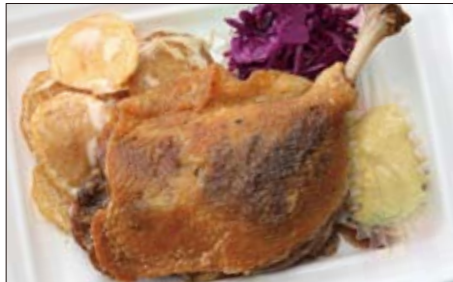
フランス産 鴨もも肉のコンフィ(1本) 1,300円