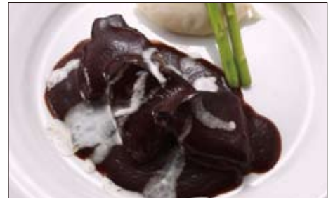
3時間煮込んだ牛ホホ肉の赤ワイン煮 1,300円