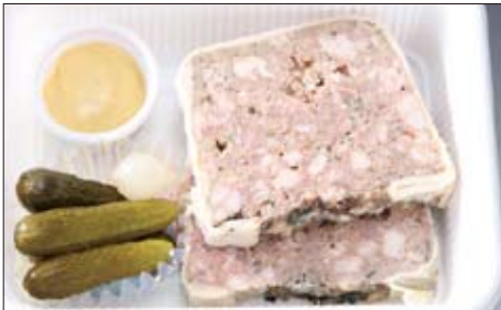
フォウグラ入り田舎風パテ(200g) 1,000円