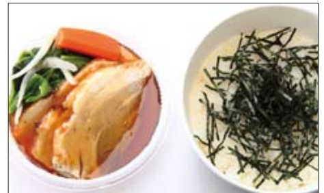
幻の豚肉 "東京X" のやわらか煮どんぶり 1,200円