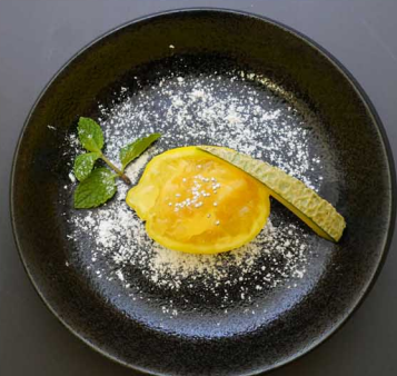
レモンシャーベット