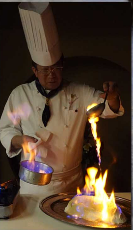
塩釜焼きはシェフによりその場で仕上げます。