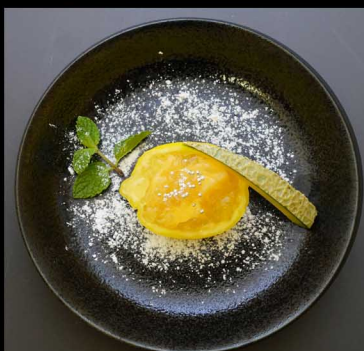
レモンシャーベット