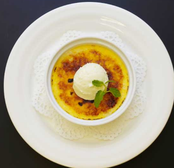
クリームブリュレ