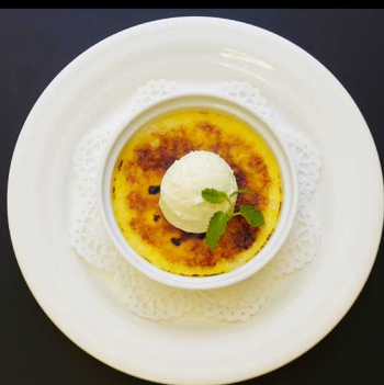
クリームブリュレ